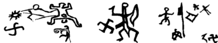
▲ 西藏史前岩画：万字符+万舞第一舞姿